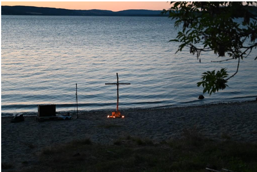
Bilde fra kveldsgudstjeneste på sommerleiren